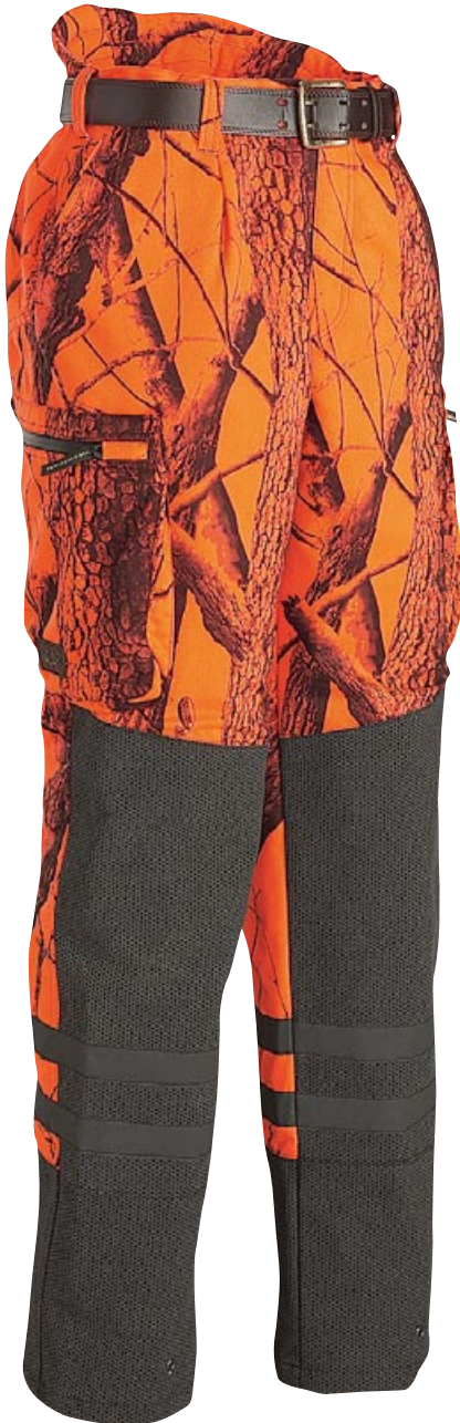
DUNDEE HW BLAZE®